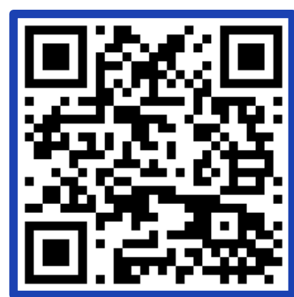
경영지원직 STORY가 궁금하다면?