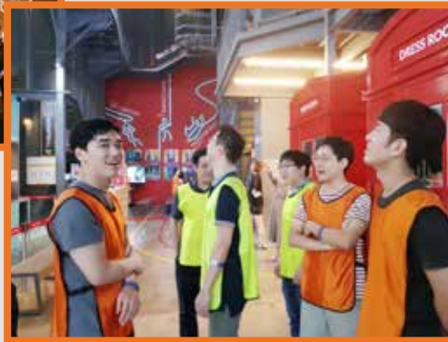
다양한 팀 빌딩 활동을 통한 주기적 사내 교류