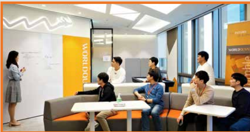
1:1 멘토링 및 체계적인 신입사원 오리엔테이션 프로그램, 주기적 세미나를 통한 지식 공유, 리더십/커뮤니케이션 등 소프트 스킬 트레이닝 제공