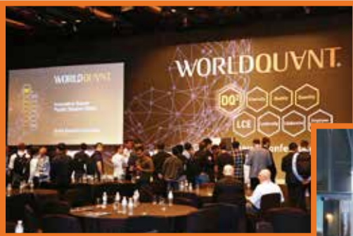
다양한 해외지사 방문 및 글로벌 컨퍼런스 참석의 기회